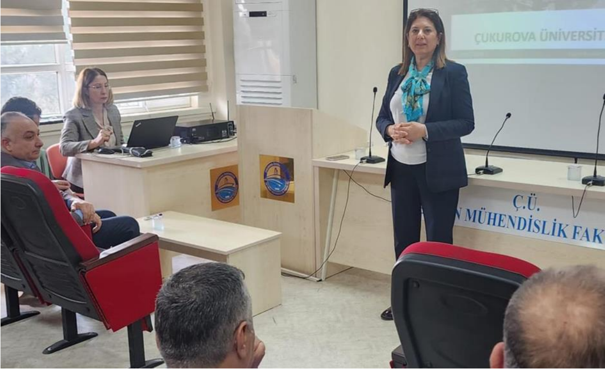
Resim 3. Ceyhan Mühendislik Fakültesi ve Ceyhan Meslek Yüksekokulu ziyareti