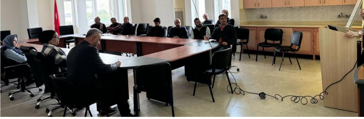
Resim 12. İlahiyat Fakültesi ziyareti