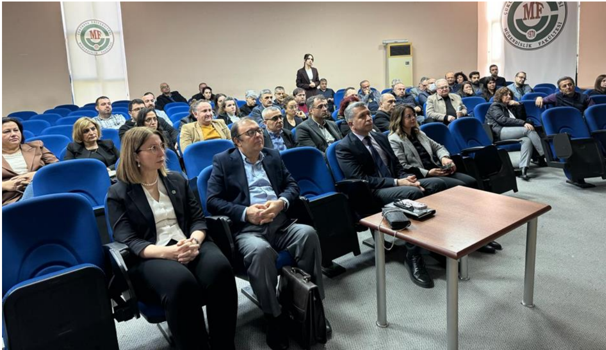
Resim 9. Mühendislik Fakültesi ziyareti