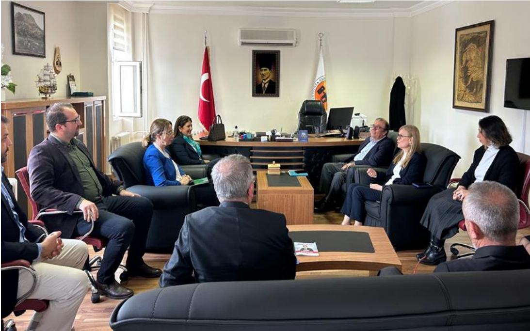
Resim 8. Kozan yerleşkesi ziyareti