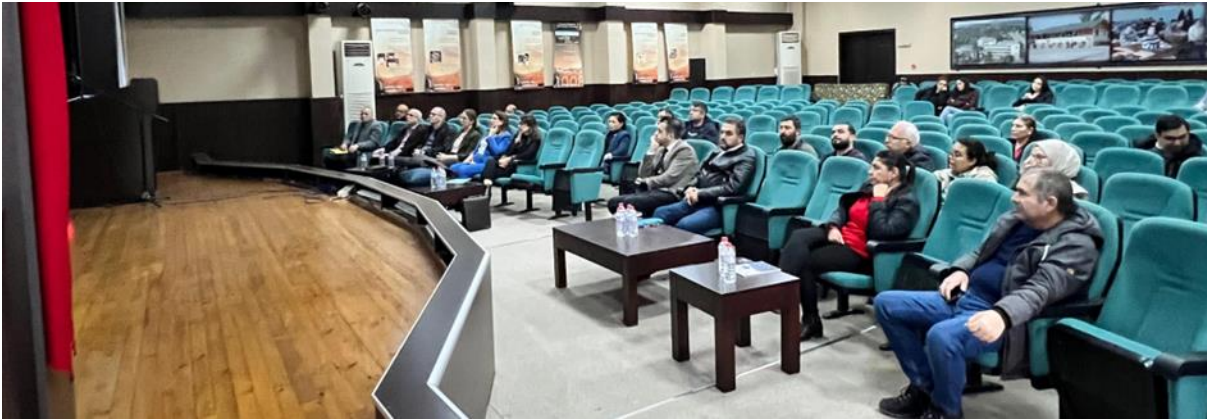
Resim 9. Adana Meslek Yüksekokul ziyareti