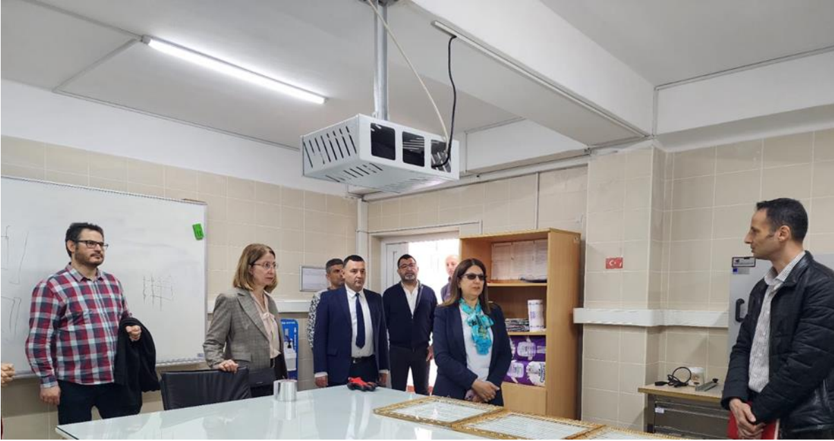
Resim 2. AOSB Teknik Bilimler Meslek Yüksekokulu ziyareti