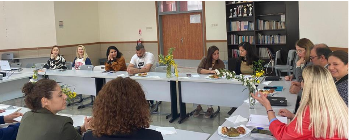
Resim 21. Spor Bilimleri Fakültesi ziyareti