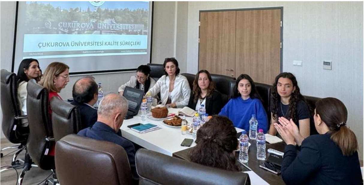
Resim 18. Eczacılık Fakültesi ziyareti