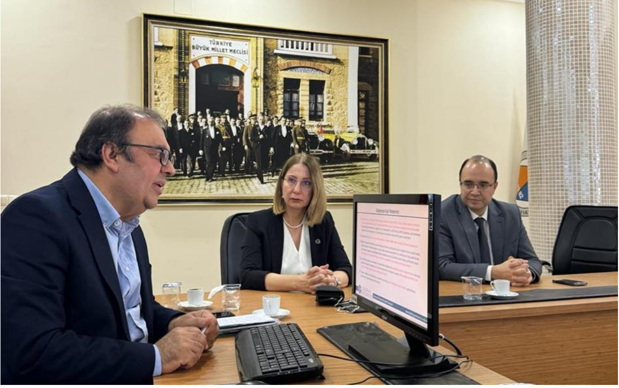
Resim 9. İktisadi ve İdari Bilimler Fakültesi ziyareti