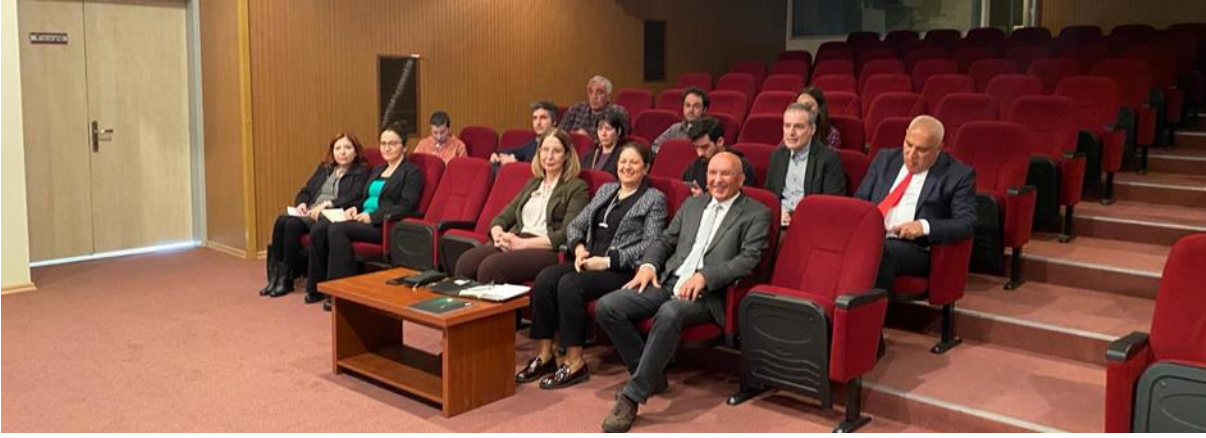
Resim 16. İletişim Fakültesi ziyareti