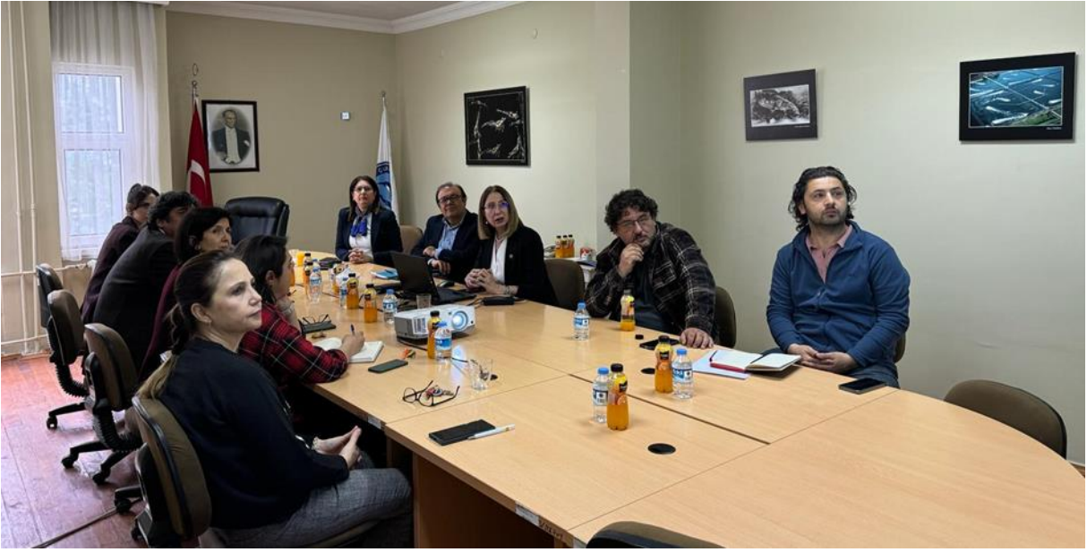
Resim 11. Su Ürünleri Fakültesi ziyareti