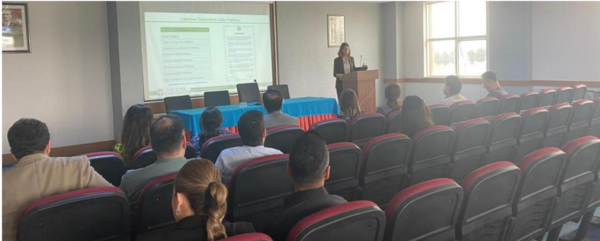
Resim 17. Hukuk Fakültesi ziyareti