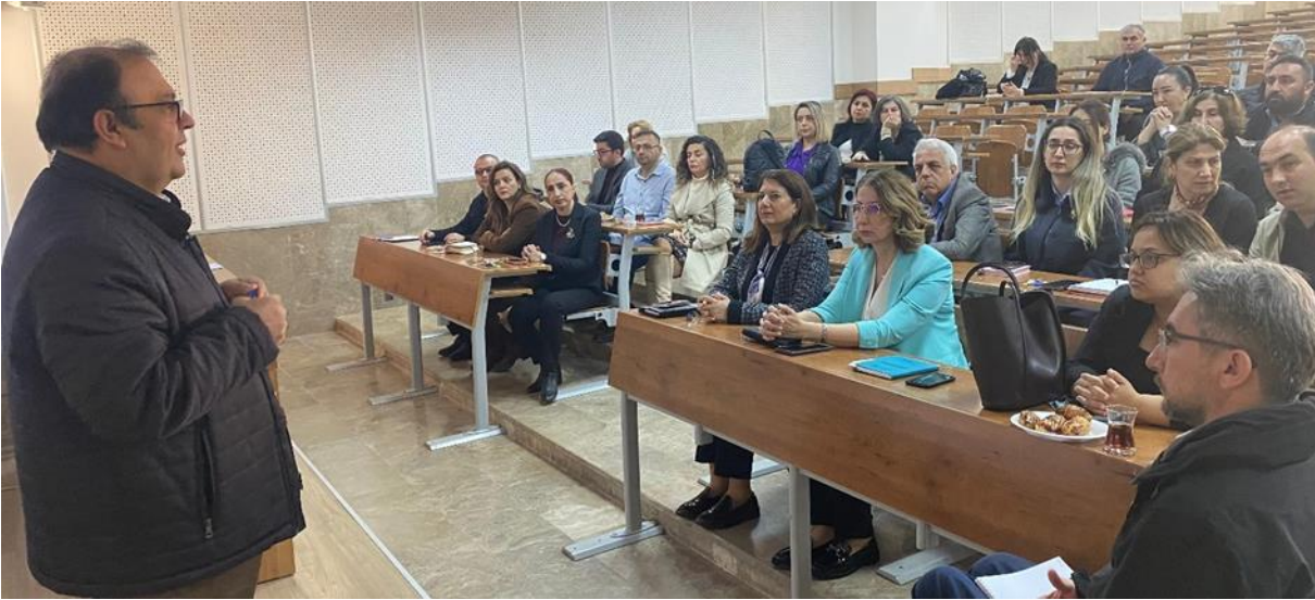
Resim 5. Meslek Yüksekokulları ve YADYO yapılan sunumlar