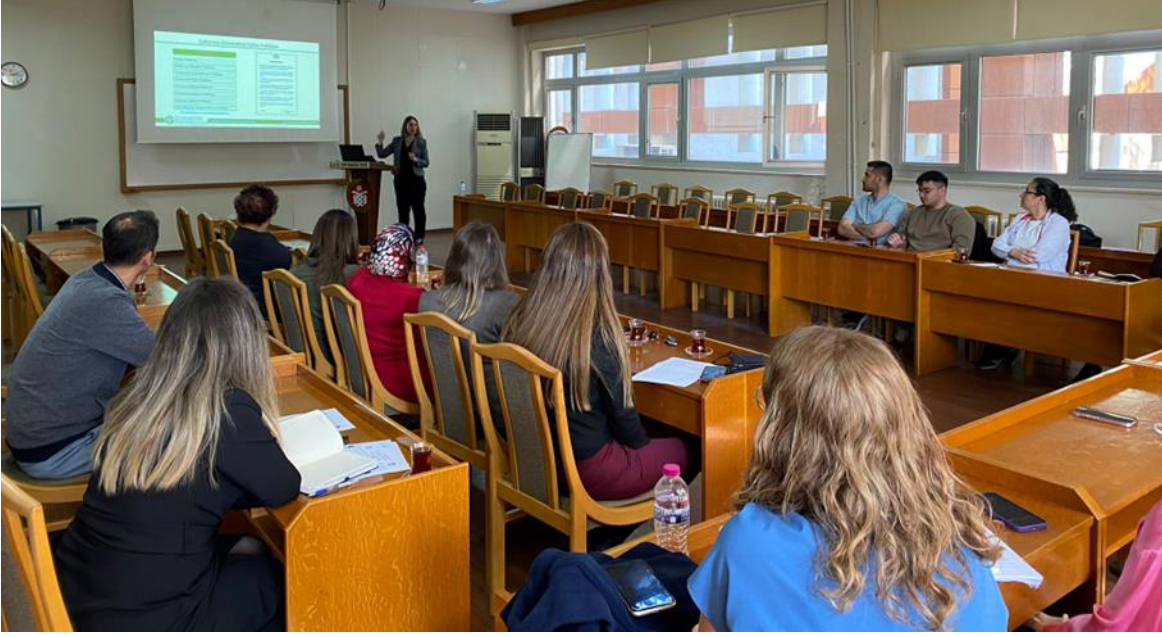
Resim 1. Tıp Fakültesi ziyareti