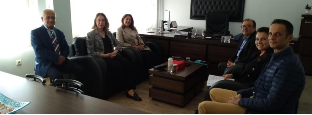
Resim 4. Karaisalı Meslek Yüksekokulu ziyareti