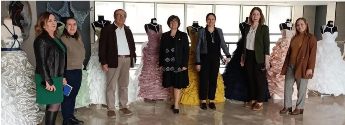
Resim 15. Güzel Sanatlar Fakültesi ziyareti