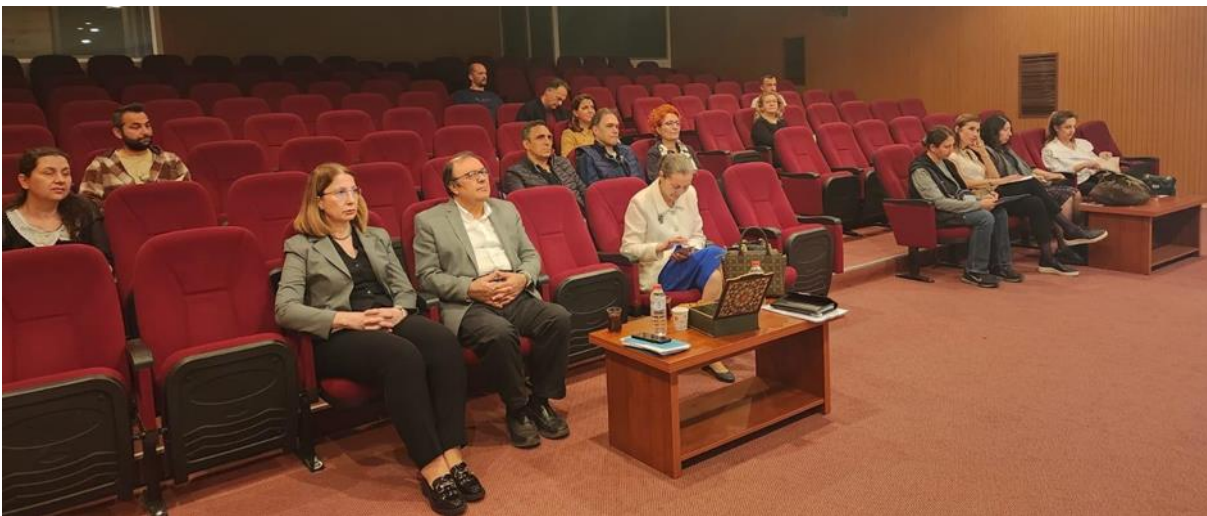
Resim 20. Mimarlık Fakültesi ziyareti