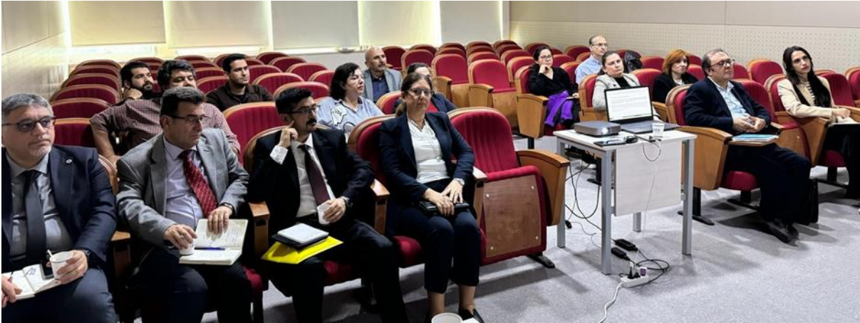
Resim 19. Veteriner Fakültesi ziyareti