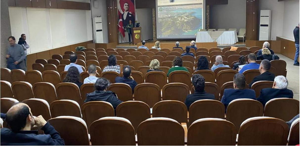
Resim 6. Ziraat Fakültesi ziyareti