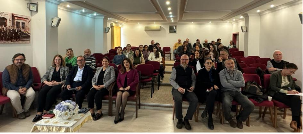
Resim 13. Eğitim Fakültesi ziyareti