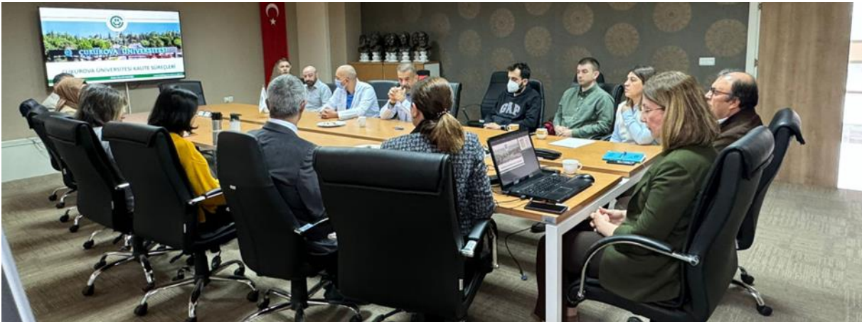
Resim 14. Dış Hekimliği Fakültesi ziyareti