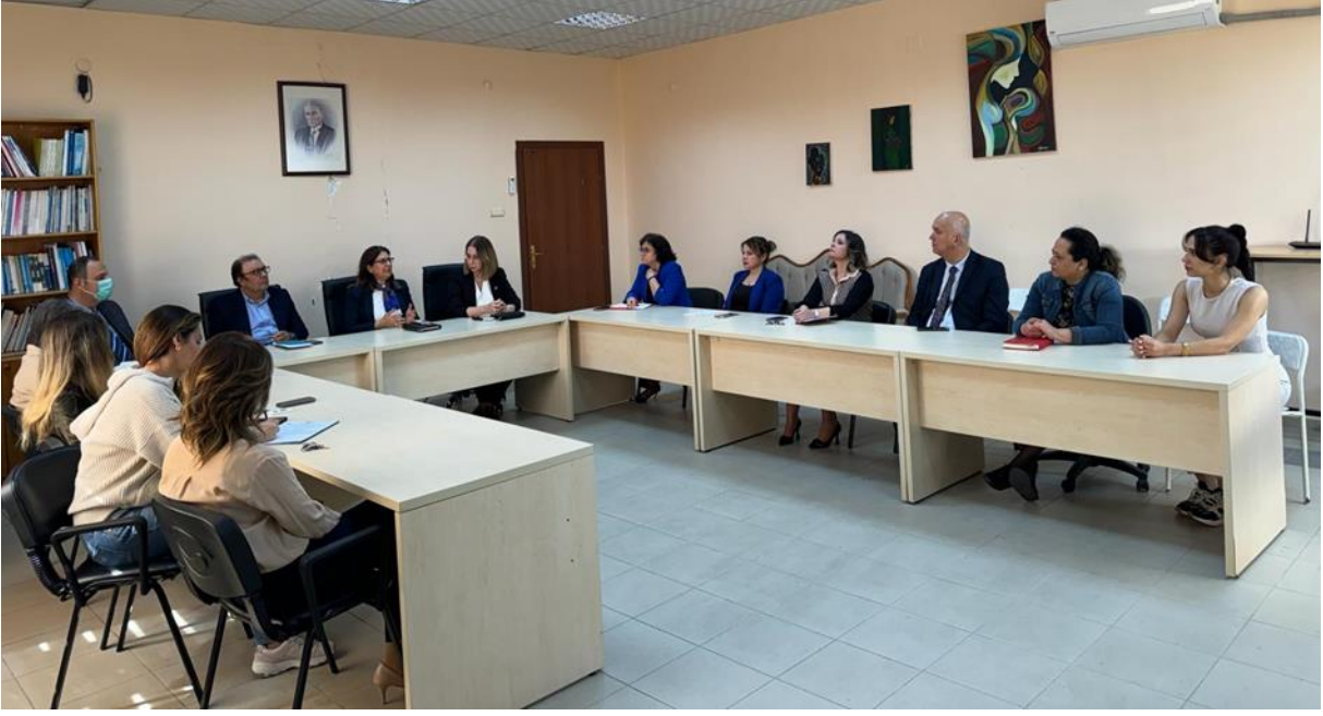
Resim 10. Sağlık Bilimleri Fakültesi ziyareti