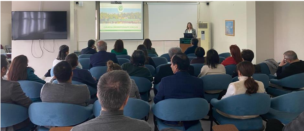
Resim 7. Fen-Edebiyat Fakültesi ziyareti